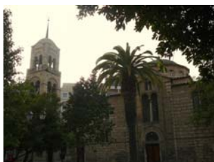
Den russiske Kirke på Filellinon

Kirken er en af de ældste og smukkeste byzantinske kirker i Athen, bygget omkring 1031. Dens historie ville være spændende at dykke ned i, og der er rester under fundamentet af en tidligere kirke og endnu ældre af et romersk bad. I 1847 købte den russiske regering kirken, som blev gennemgribende restaureret under zar Alexander II. Siden har den været den russisk-ortodokse menigheds kirke i Athen.