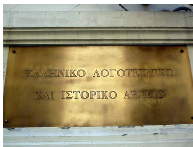
Athens historiske og litterære Arkiv

Desuden besøgte jeg Benaki Museets Bibliotek i bygningens kælderetage og dagen efter også dets Arkiv, som har til huse i Benakifamiliens gamle, smukke villa i Kifisia.