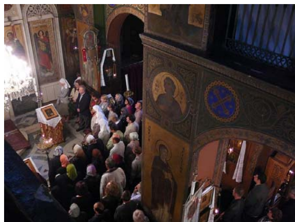
Medlemmer af koret og kantoren på pulpitret og et kig ned i kirken under messen